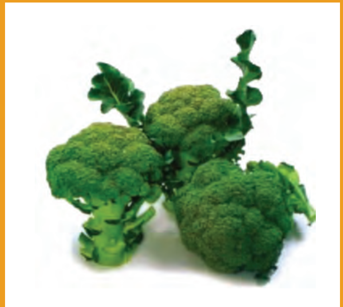
Рис. 2. Гибрид брокколи Маратон F 1 .