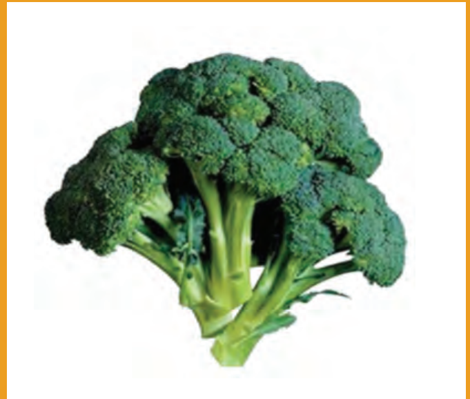
Рис. 1. Брокколи сорт Тонус.

Гибрид Маратон F 1 – период вегетации около 80 суток. Центральное соцветие шарообразное, наружная поверхность гладкая с небольшими выступами и очень уплотненная. Продуктивность высокая – с гектара можно собрать 36-40 т плодов. Маратон F 1 неприхотлив к почвам, допускает разнообразие методик возделывания и приспособлен к механизированным приемам агротехники. Плоды имеют отличный вкус, могут употребляться и храниться как свежесобранными, так и подвергнутыми термообработке и замораживанию (рис. 2).