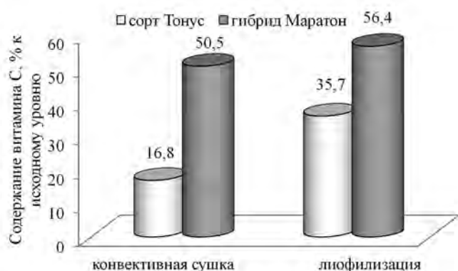
Рис. 3. Сохранность витамина С в брокколи при конвективной и лиофильной сушке соцветий брокколи.

Содержание фотосинтетических пигментов устанавливали спектрофотометрически по величине поглощения ацетонового экстракта при 663, 647 и 470 нм [12], используя формулы расчета содержания: