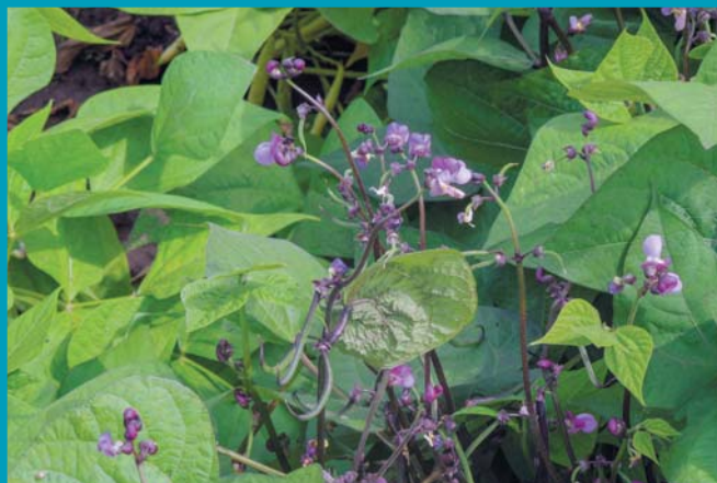
Сорт Виола - цветение

По данным О.С. Корзун и А.С. Бруйло, «...в зависимости от значения коэффициента регрессии сорта сельскохозяйственных растений делятся на два типа: сорта нейтрального типа, со значением коэффициента регрессии значительно ниже единицы, и сорта интенсивного типа с высокой экологической пластичностью – значение коэффициента выше единицы...» [16]. Коэффициент регрессии, равный или больше единицы, говорит о высокой отзывчивости и пластичности образца, при значении меньше нуля или приближенное к нулю – позволяет сделать вывод о низкой адаптивности сорта к изменениям окружающей среды.