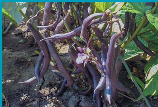
Сорт Виола - бобы