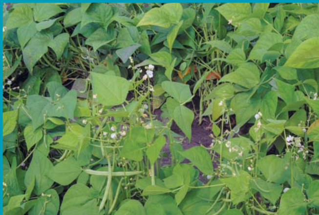
Сорт Дарина - цветение