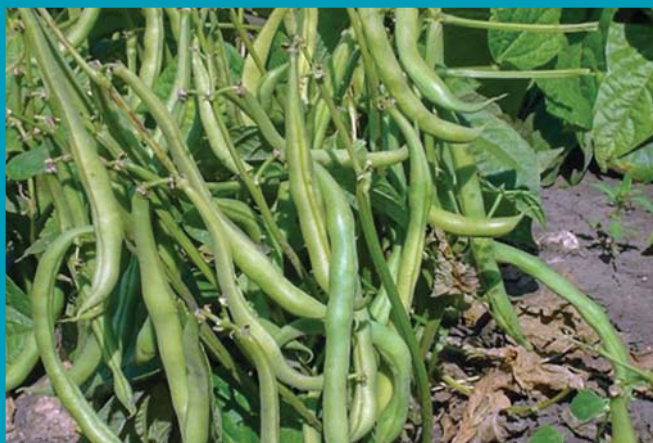
Сорт Дарина - бобы