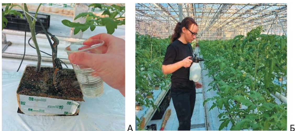
Рис. 2. Постановка производственного опыта в теплице СХПК «Тепличный»: А - первичное внесение препаратов путем полива; Б - опрыскивание растений при вторичном внесении исследуемого препарата Fig. 2. Setting up production experience in the greenhouse of the greenhouse complex "Teplichny": А - primary application of drugs by irrigation; В - spraying of plants with secondary application of the studied drug