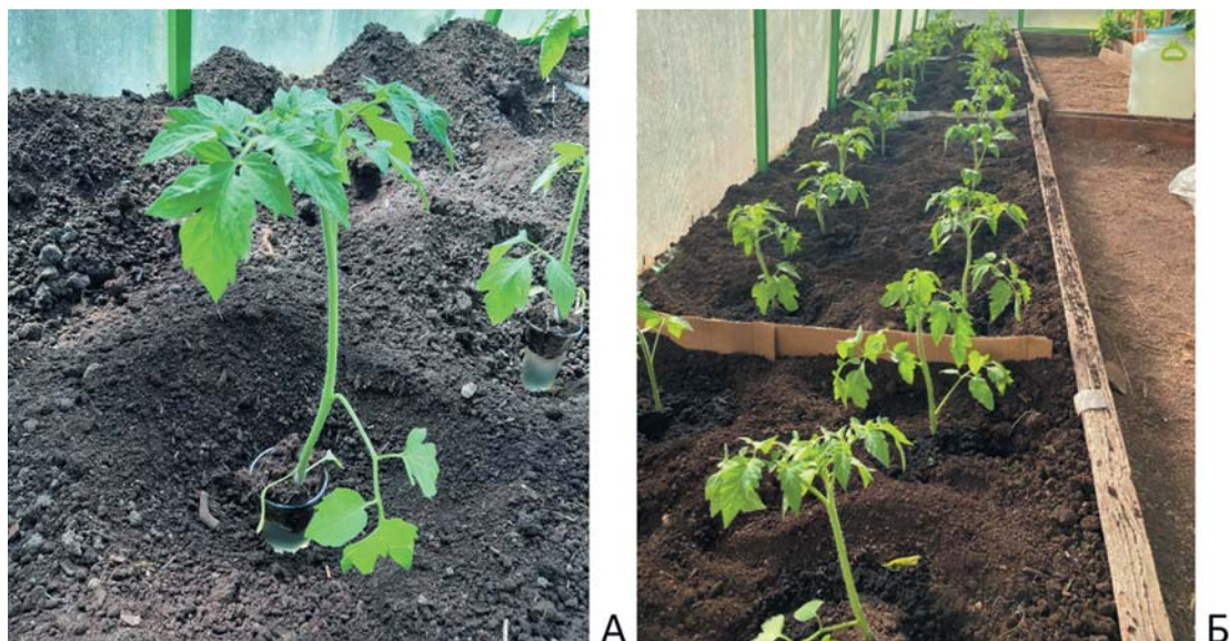
Рис. 1. Постановка опыта в поликарбонатной теплице ВолНЦ РАН: А – замачивание корневой системы в растворе биопрепарата «Натурост» при посадке; Б – общий вид теплицы Fig. 1. Setting up an experiment in a polycarbonate greenhouse of the VolSC RAS: А – soaking of the root system in a solution of the biological product "Naturest" during planting; В – general view of the greenhouse

В производственном опыте (рис. 2) внесение препарата осуществляли путем полива корневой системы в период пересадки растений на стекловату (100 мл под растение) и опрыскивания филлосферы растений спустя 2 недели после пересадки. Каждый вариант включал в себя по 16 растений (по 4 емкости с субстратом, в каждом по 4 растения).